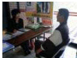
【相談窓口イメージ図】