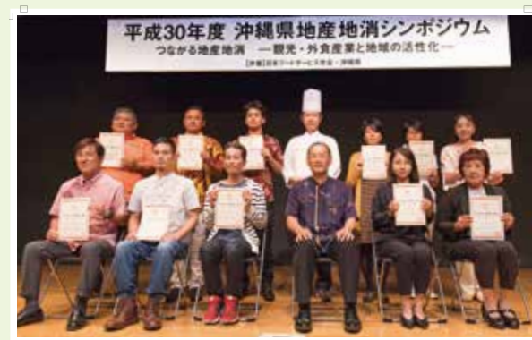
『平成30年度 新規登録店舗(26店舗)』