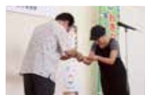
(4)登録証交付式の様子