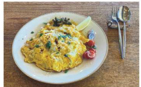
みやぎ農園の平飼卵 オムライスセットドリンク付き(1,600円)

木を基調とした温もりある開放感のある店内には、手作りのテーブルや椅子、食器や絵画がディスプレイされ、調和されたアート空間を演出しています。