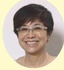
新 かわひら かずえ 川平 一枝 しびらんか