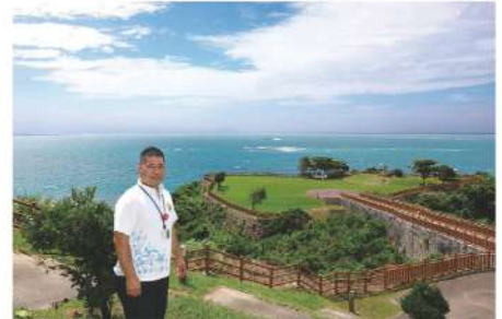
最近、訪れる人が増えている人気スポット「知念岬公園」

また、コロナ禍により観光客が減ったことから、地元の人々が楽しんで時間を過ごせる場所や企画を考えていきたいと話します。