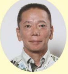
新 ふてんま くにとむつ 普天間 邦光 (有)三大食品