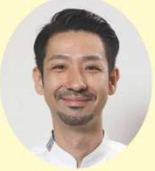
おおしろ ゆうき 大城 優輝 大和食品