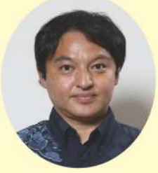
新 なかもと はじめ 仲本 源 (株)ナカモト