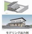
モデリング出力例