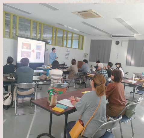
(写真は昨年の様子)