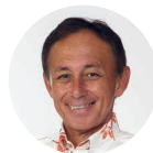
沖縄県知事 玉城 デニー

登壇者により、おきなわブランド戦略によって沖縄のポテンシャルを価値に変え、それを訪れる人と住まう人で分かち合う、目指す沖縄の姿について語っていただきます。